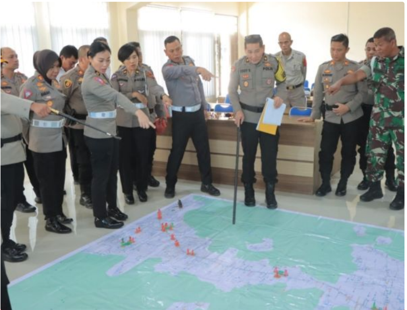
Tactical Floor Game Pengamanan PON XXI Aceh-Sumut, dilaksanakan Polres Tanah Karo, Senin (26/08-2024)

KARO - Untuk melakukan pengamanan disatu acara yang bertaraf nasional, tentunya tidaklah gampang. Segala bentuk persiapan harus disiapkan secara matang.