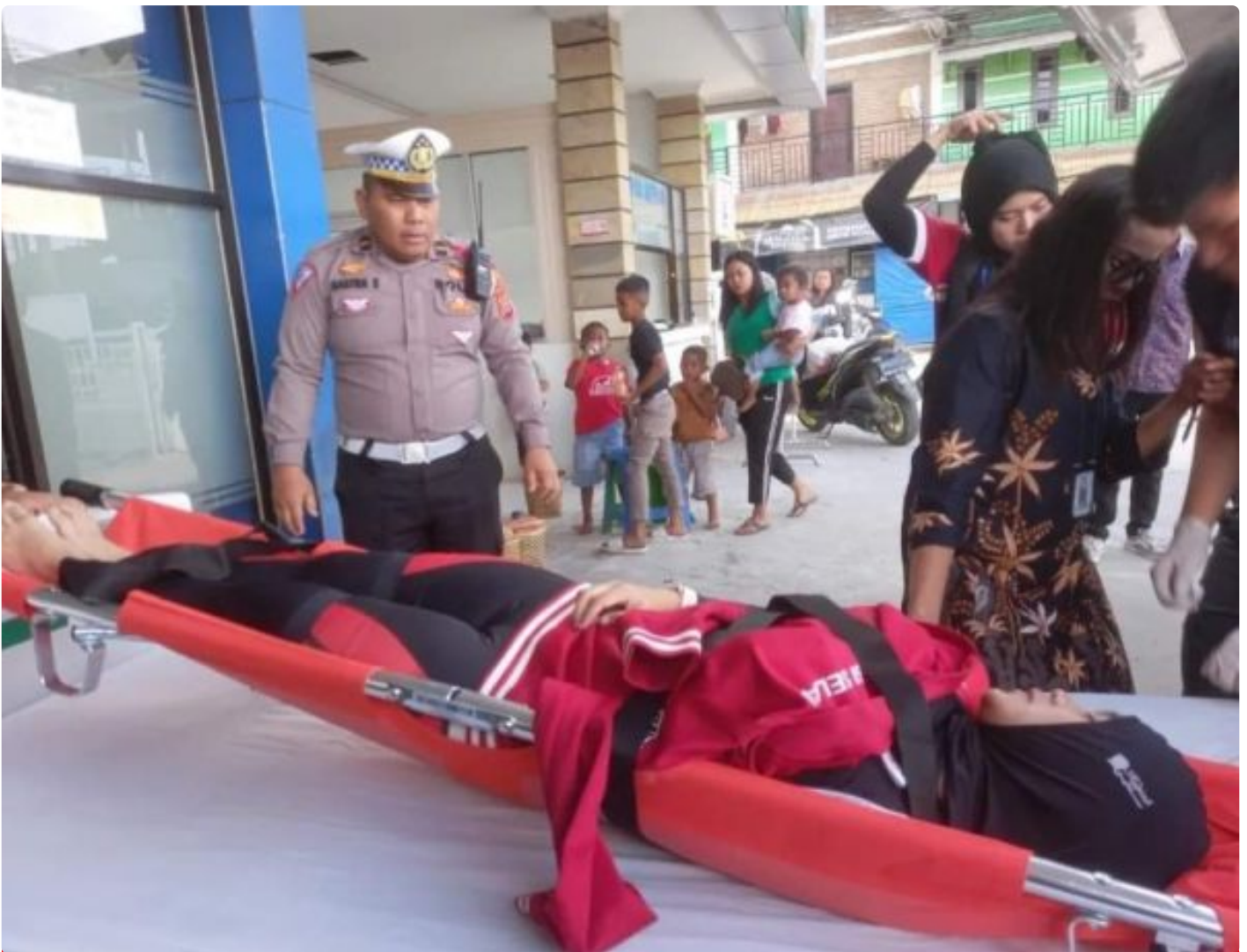
Tim Pengamanan Polres Tanah Karo, saat mengevakuasi Atlet Sepeda Gunung yang cedera, Jumat (06/09-2024)

KARO - Disetiap gelanggang olahraga, tentunya para atlet sering mengalami cedera saat sedang berlaga.